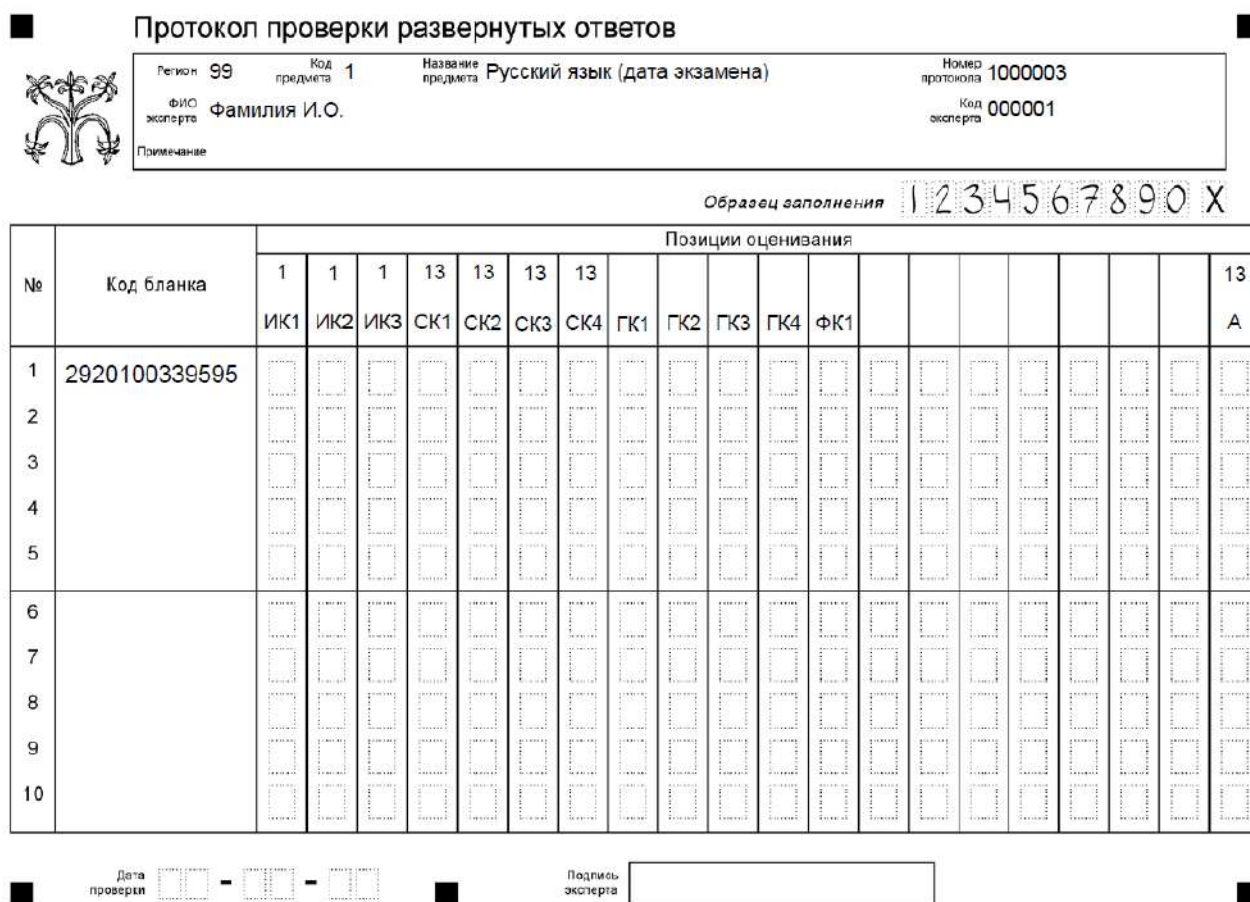
Рисунок 1. Вариант формата бланка протокола проверки развёрнутых ответов 4

Внимание! При выставлении баллов за выполнение задания в протокол проверки развёрнутых ответов следует иметь в виду, что если ответ отсутствует (нет никаких записей, свидетельствующих о том, что экзаменуемый приступал к выполнению задания), то в протокол проставляется «X», а не «0».