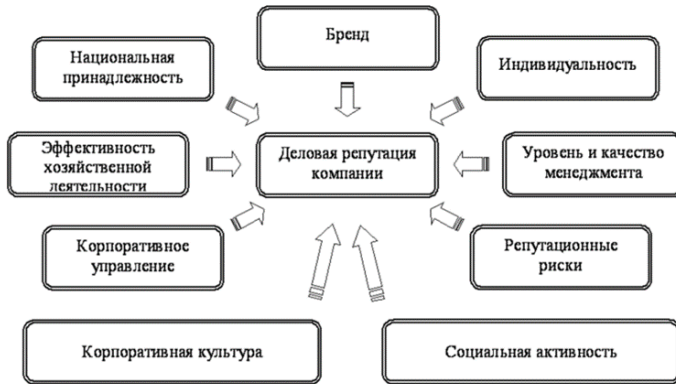
Рисунок 1. Составляющие деловой репутации [6, с. 10]

Наглядный пример приведен Н.П. Козловой автором статьи «Формирование деловой репутации компании» (рисунок 1).